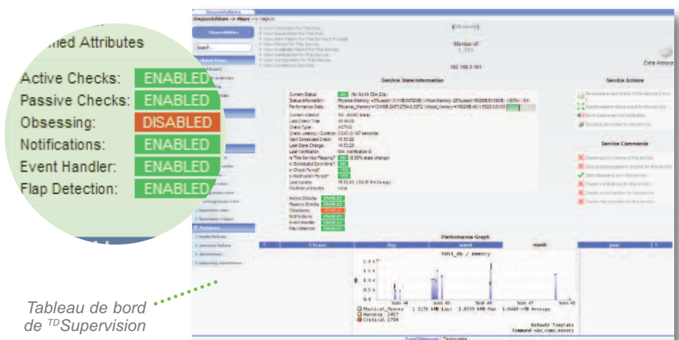
Tableau de bord de TD Supervision